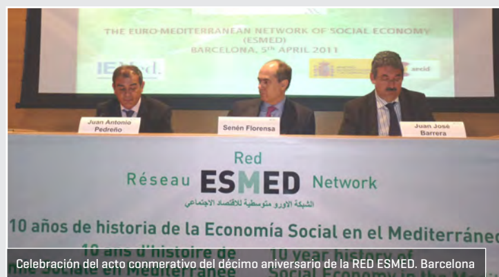
Celebración del acto conmemorativo del décimo aniversario de la RED ESMED. Barcelona

Un recorrido de su evolución, hasta nuestros días