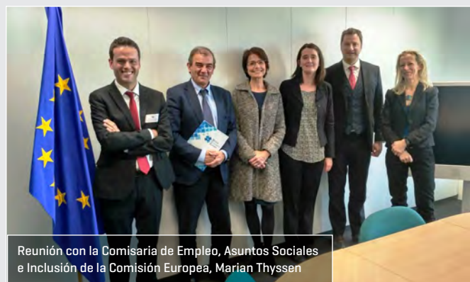
Reunión con la Comisaria de Empleo, Asuntos Sociales e Inclusión de la Comisión Europea, Marian Thyssen