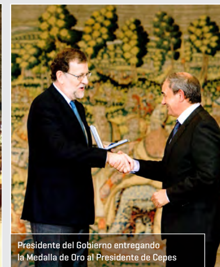
Presidente del Gobierno entregando la Medalla de Oro al Presidente de Cepes