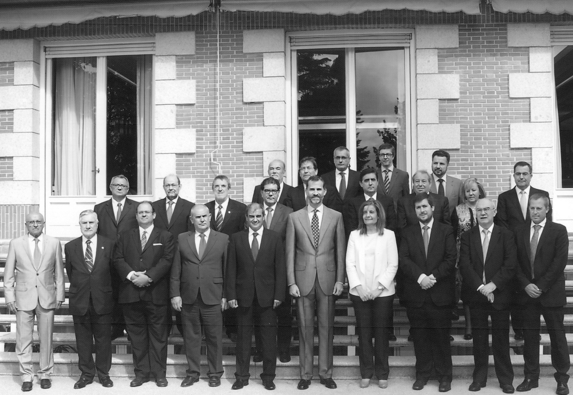
2012. Audiencia con el Rey Felipe VI de la Junta Directiva de Cepes. Año Internacional de las Cooperativas proclamado por Naciones Unidas