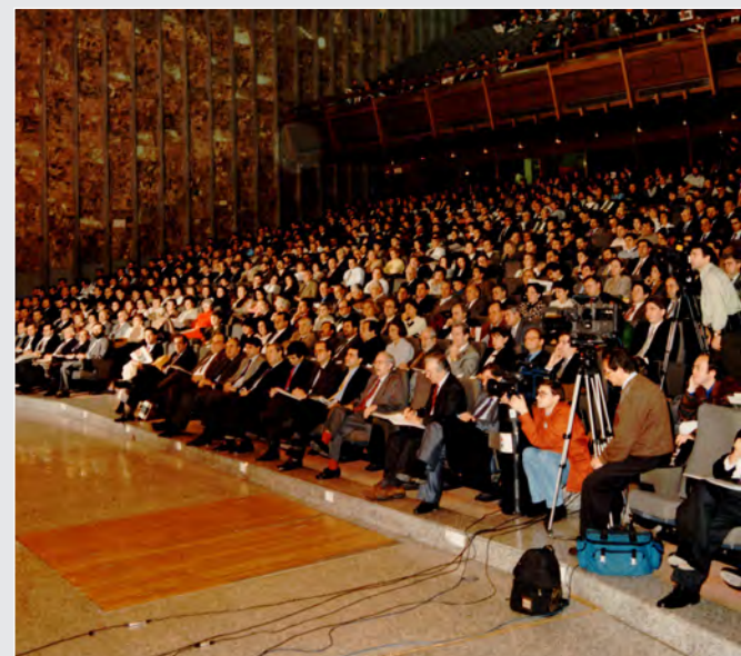
Primer congreso Economía Social en Madrid. 1997. Inauguración con Nacis Serra, Vicepresidente del Gobierno