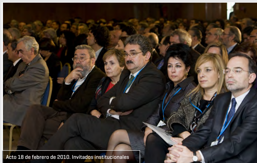
Acto 18 de febrero de 2010. Invitados institucionales