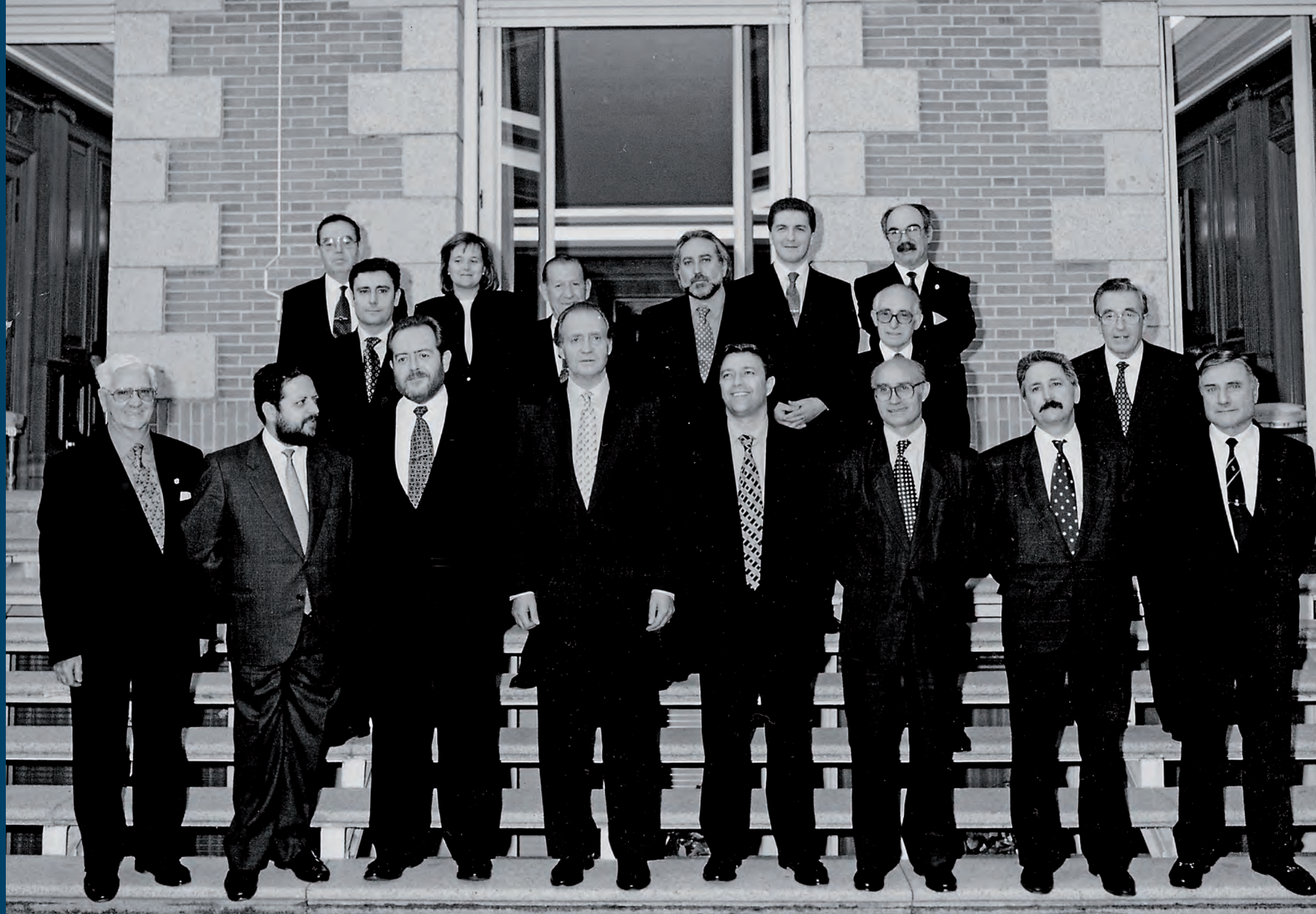
Audiencia del Rey Juan Carlos con la Junta Directiva de CEPES