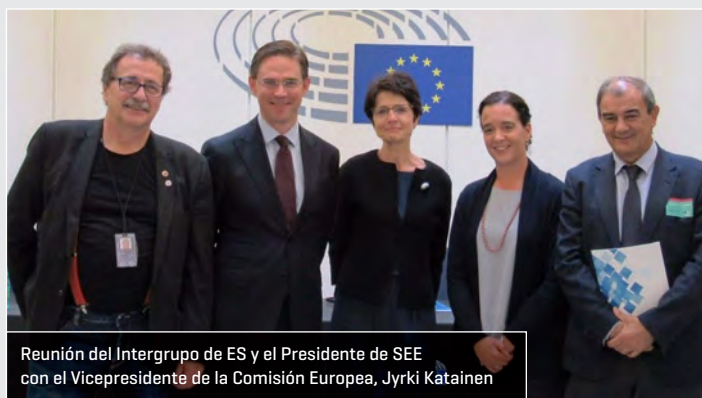
Reunión del Intergrupo de ES y el Presidente de SEE con el Vicepresidente de la Comisión Europea, Jyrki Katainen