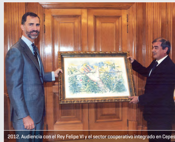
2012. Audiencia con el Rey Felipe VI y el sector cooperativo integrado en Cepes