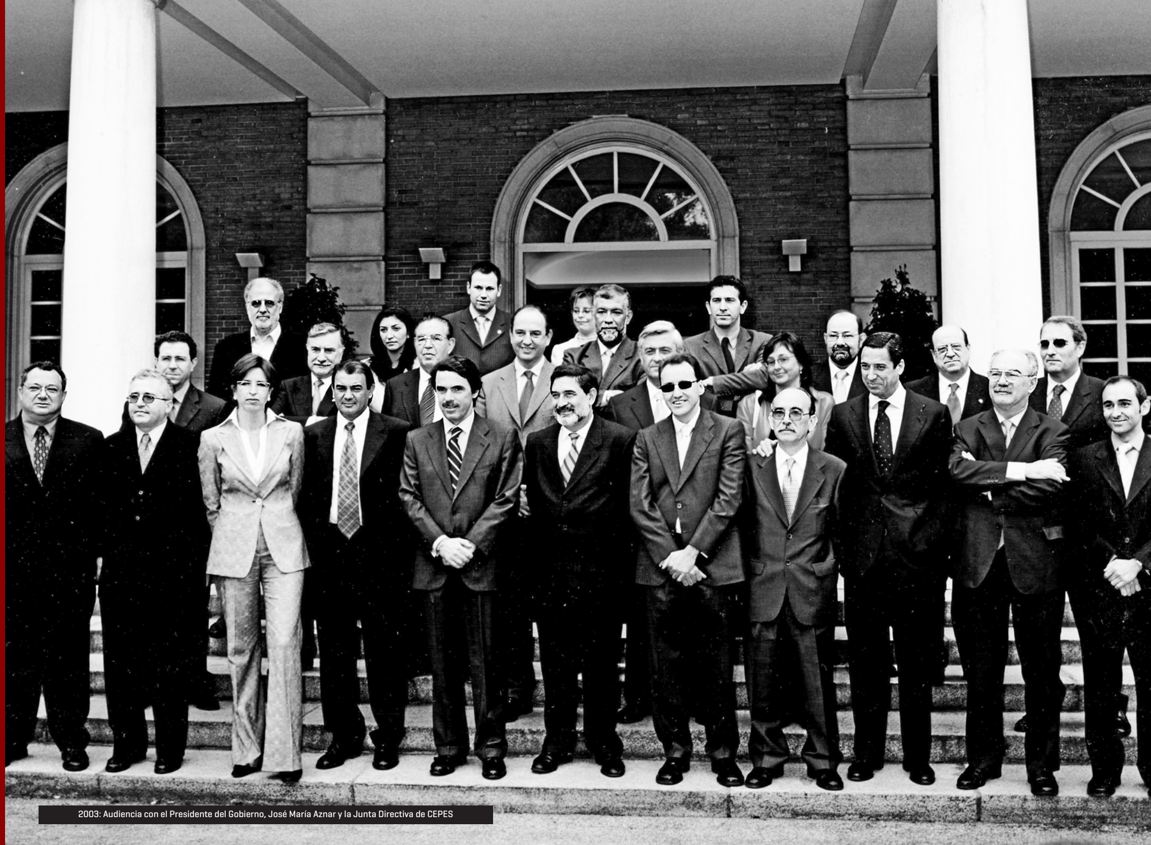
2003: Audiencia con el Presidente del Gobierno, José María Aznar y la Junta Directiva de CEPES