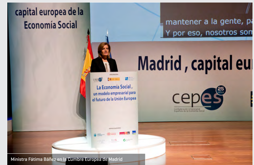
Ministra Fátima Báñez en la Cumbre Europea de Madrid

La Declaración de Madrid, junto con las Declaraciones de Roma, Luxemburgo y Bratislava fueron sido claves para impulsar la aprobación de un Plan de Acción Europeo de la Economía Social.