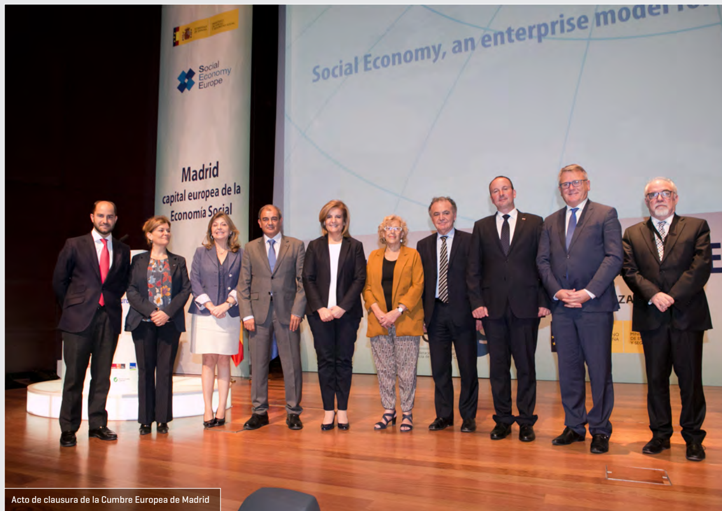
Acto de clausura de la Cumbre Europea de Madrid

El 23 de mayo de 2017, CEPES en colaboración con el Gobierno de España y Social Economy Europe celebró la Cumbre de Madrid que contó con la participación de las Comisarias Thyssen y Bieńkowska, responsables respectivamente en la Comisión de las políticas de empleo y de empresa, del Vicepresidente del Parlamento, Ramón Luis Valcárcel, y el Presidente del CESE, George Dassis, quienes junto con la Ministra Fátima Báñez y altos representantes Ministeriales de otros 10 Gobiernos, lanzaron desde la Unión Europea una señal inequívoca de apoyo a la Economía Social y de compromiso con su desarrollo que en Europa cuenta con 2,8 millones de empresas que generan el 8% del PIB comunitario y dan empleo a cerca de 13,6 millones de personas.