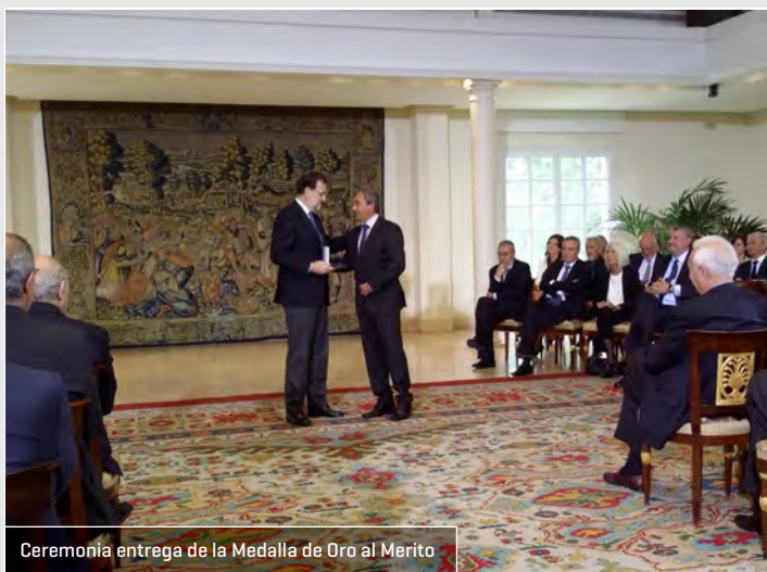
Ceremonia entrega de la Medalla de Oro al Mérito

Además CEPES ha recibido otros reconocimientos así como premios por el papel que juega en el fomento y defensa de la Economía Social. Señalamos especialmente el recibido por SERVIMEDIA, los premios ATA y los Premios CORRESPONSABLES por la labor de CEPES en la defensa e implantación de la Responsabilidad Social.