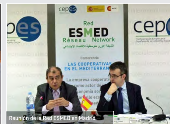
Reunión de la Red ESMED en Madrid