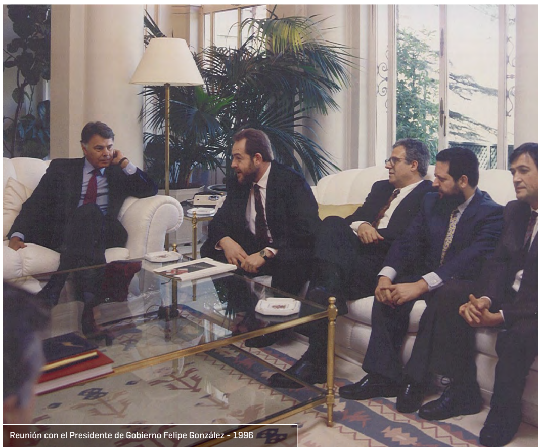
Reunión con el Presidente de Gobierno Felipe González - 1996