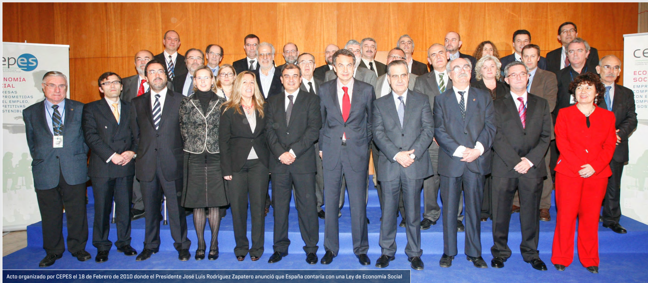
Acto organizado por CEPES el 18 de Febrero de 2010 donde el Presidente José Luis Rodríguez Zapatero anunció que España contaría con una Ley de Economía Social