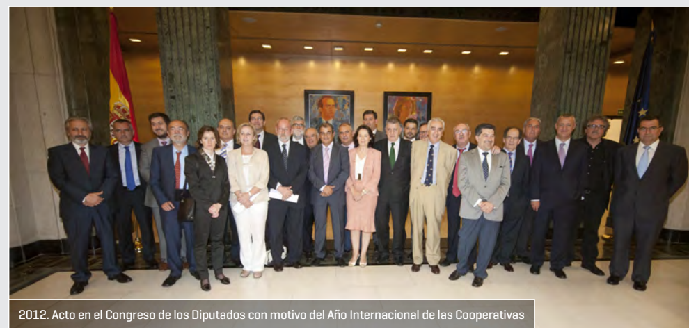
2012. Acto en el Congreso de los Diputados con motivo del Año Internacional de las Cooperativas