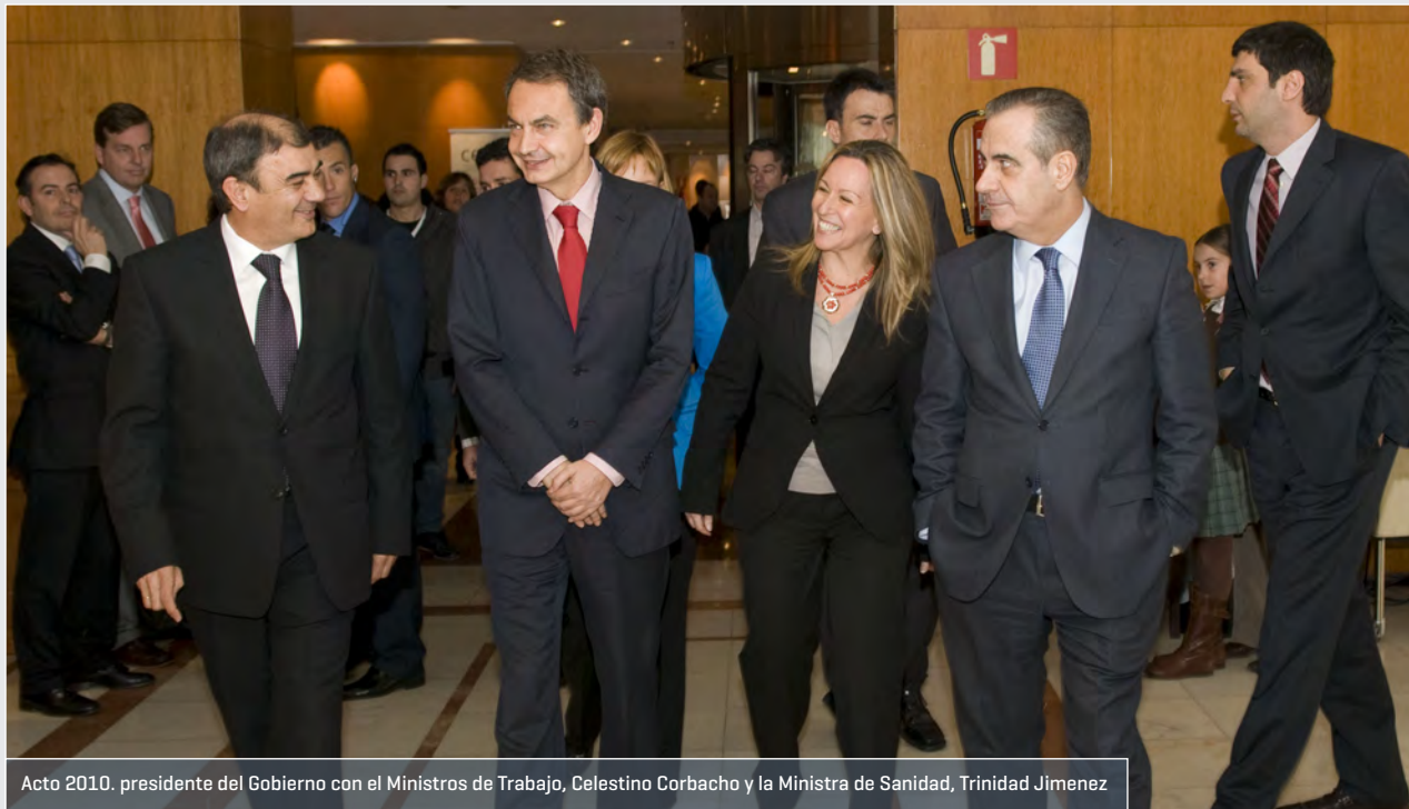
Acto 2010. presidente del Gobierno con el Ministros de Trabajo, Celestino Corbacho y la Ministra de Sanidad, Trinidad Jiménez