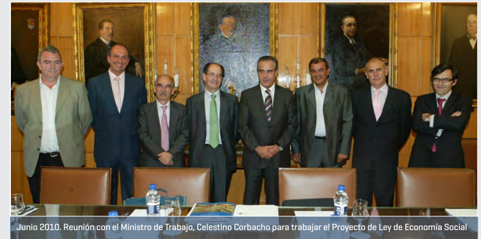
Junio 2010. Reunión con el Ministro de Trabajo, Celestino Corbacho para trabajar el Proyecto de Ley de Economía Social

Desde su aprobación, la Ley de Economía Social española ha sido un referente para muchos países europeos.