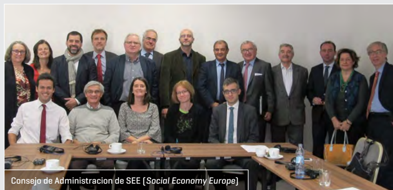
Consejo de Administración de SEE (Social Economy Europe)