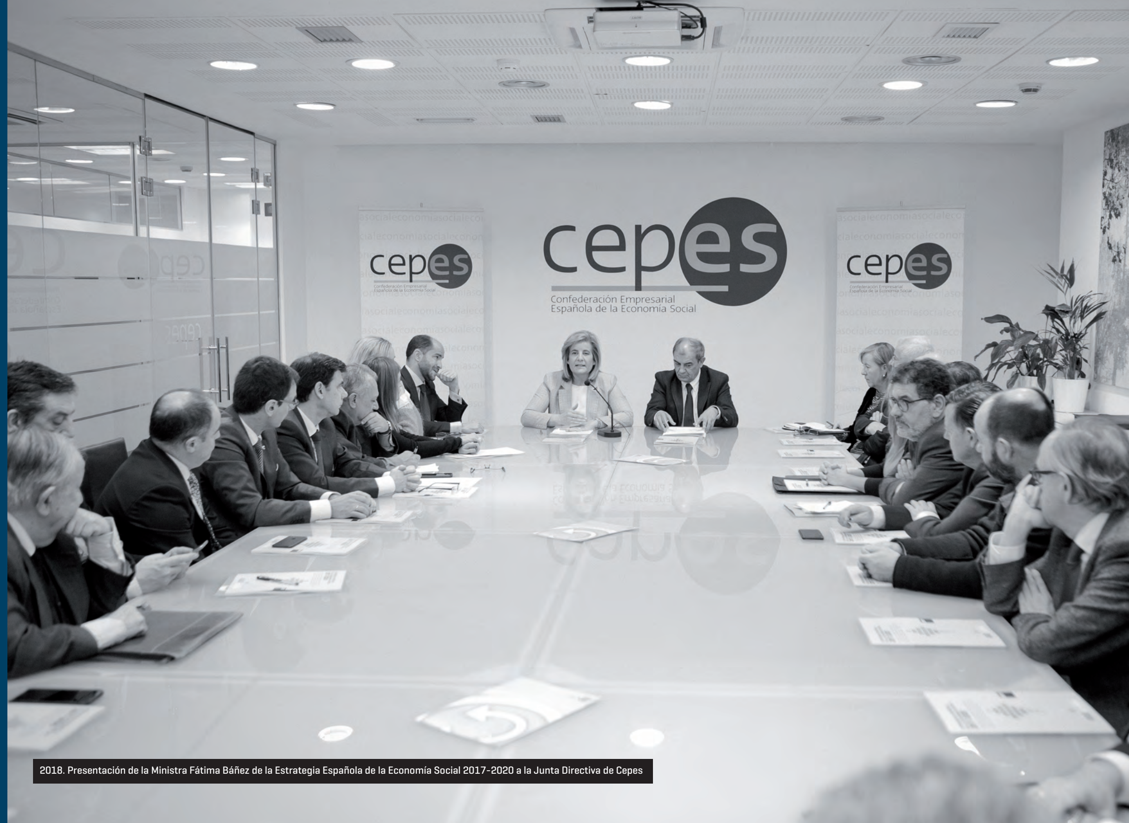
2018. Presentación de la Ministra Fátima Báñez de la Estrategia Española de la Economía Social 2017-2020 a la Junta Directiva de Cepes

La ministra de Empleo y Seguridad Social durante su presentación ante la Junta Directiva y medios de comunicación afirmó que “la Economía Social es una prioridad en la España de la recuperación social, un referente en Europa y uno de los mejores exponentes de la marca España”. “Sus entidades crean valor sobre la base de un crecimiento inclusivo y sostenible”