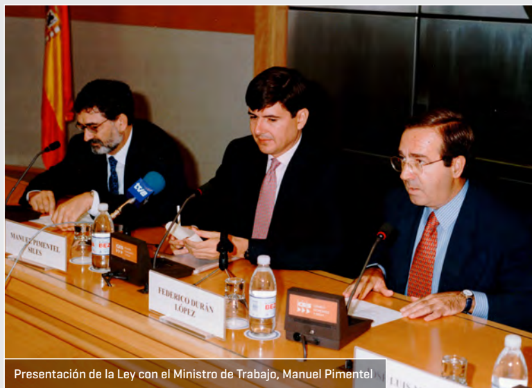
Presentación de la Ley con el Ministro de Trabajo, Manuel Pimentel