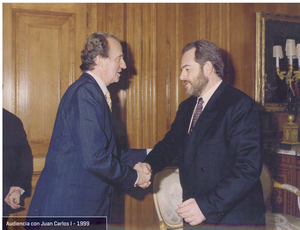
Audiencia con Juan Carlos I - 1999