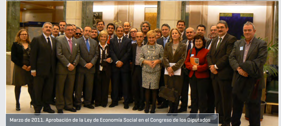
Marzo de 2011. Aprobación de la Ley de Economía Social en el Congreso de los Diputados