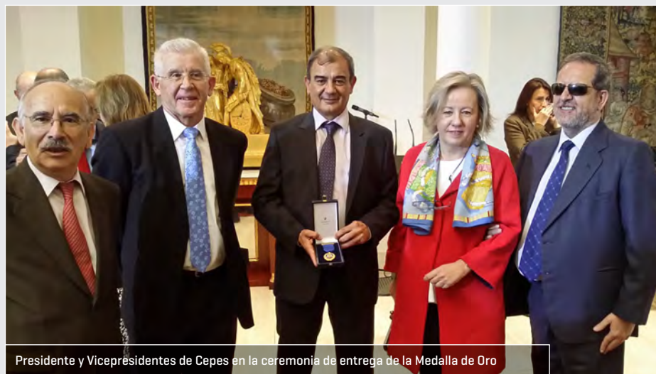
Presidente y Vicepresidentes de Cepes en la ceremonia de entrega de la Medalla de Oro