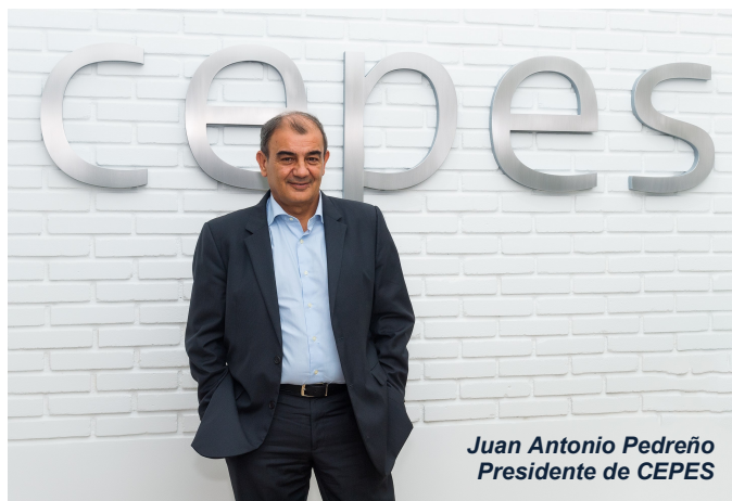
Juan Antonio Pedreño Presidente de CEPES

a alcanzarse en el año 2030 nos hace partícipes y, también, responsables de conseguir uno de los retos más ambiciosos de la próxima década: construir un futuro mejor para las generaciones venideras, basado en un crecimiento económico compatible con la salud del planeta que asegure un reparto más equitativo de la riqueza y que ofrezca mejores oportunidades de vida a todas las personas.